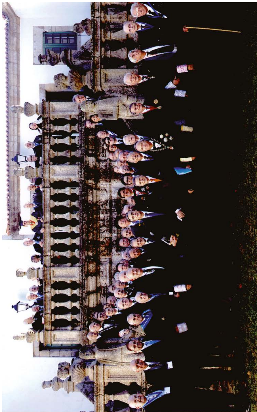
Inauguración del VII Congreso. Foto panorámica con todos los asistentes