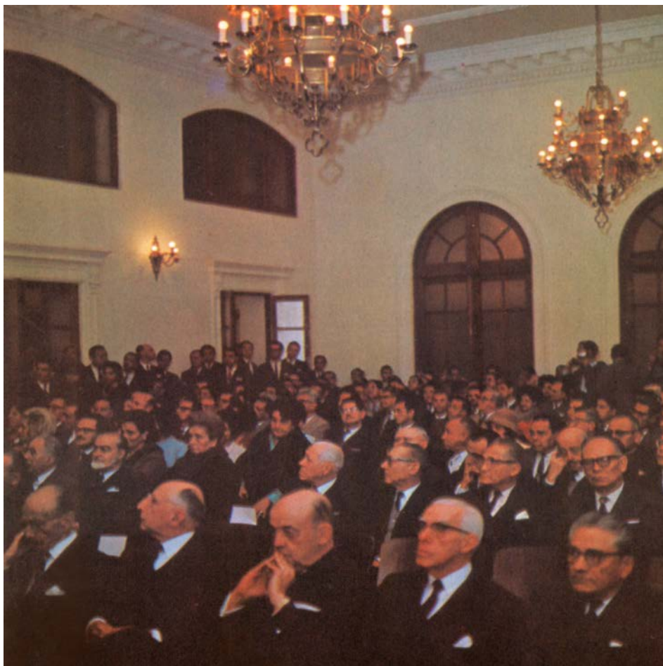
Vista parcial de la numerosa concurrencia al acto.