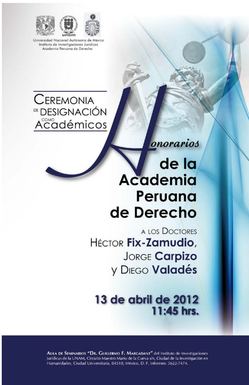
Afiche del acto de incorporación de México D.F. (2012)