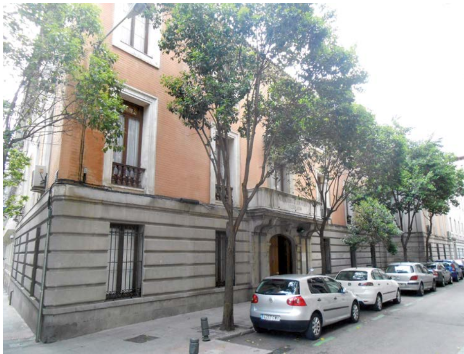
Sede de la Real Academia de Jurisprudencia y Legislación sita en la calle del Marqués de Cubas, 13 (Madrid).